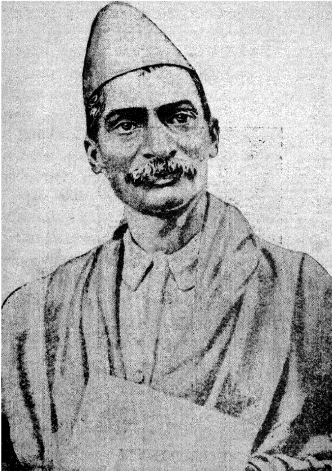
बाबू राजेंद्रप्रसाद मुंबई काँग्रेसचे अध्यक्ष, १९३४.